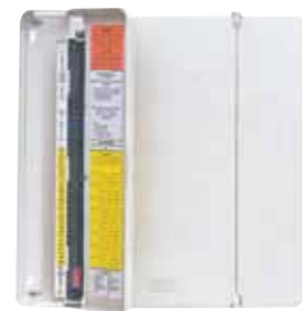
1 Centrale regelprint