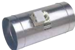
3 Zoneklep of bypassklep