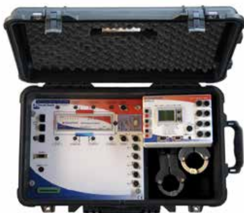
Chiller Performance Analyser koffer

In sommige situaties is er naast een conditiebepaling ook behoefte aan een uitgebreide rendementsbepaling van een koelmachine of warmtepomp. Ook hiervoor heeft Carrier een passend product: de Chiller Performance Analyser (CPA).