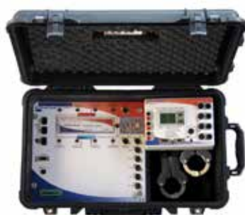
Chiller Performance Analyser koffer

Voordat u een keuze gaat maken voor het in bedrijf houden, retrofitten of vervanging van uw installatie, is het nuttig om eerst te kijken naar de energieprestaties van uw huidige R22 installatie. Dankzij de Chiller Performance Analyser (CPA) van Carrier, kunt u een real-time inzicht krijgen van de prestaties van uw installatie.